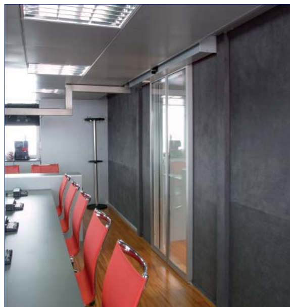
Scuderia Toro Rosso